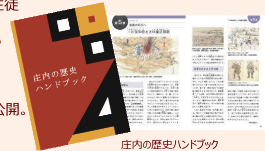
庄内の歴史ハンドブック