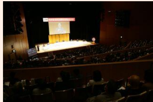
徳川宗家と「四天王」の子孫による座談会