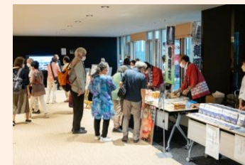
休憩時間中はエントランスの物産コーナーがにぎわった