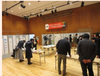
歴史文化研究コンクール作品展では小中学生の熱心な研究成果が並んだ