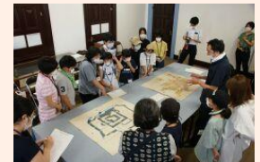
[鶴ヶ岡城] では致道博物館も見学