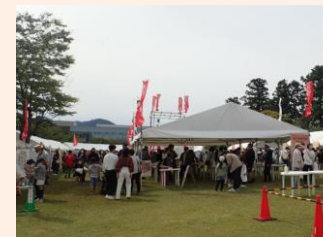
食イベント「朱の陣」の様子