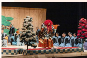
庄内藩士の嗜みであった宝生流能楽