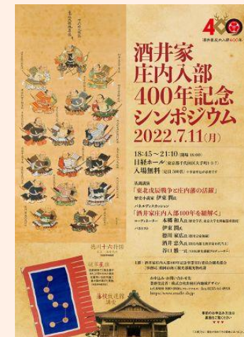
イベントリーフレット