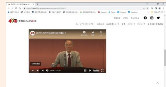
各歴史講座の動画記録は公式サイト・youtubeで配信