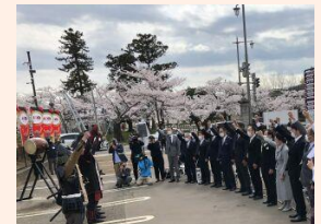
甲冑武者隊との勝鬨