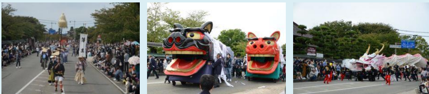
鶴岡公園から市内を練り歩く大名行列と祝賀行列