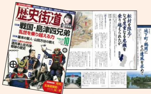
「歴史街道」10月号 歴史研究者・河合敦氏の寄稿とともに 鶴岡公園周辺の魅力を紹介