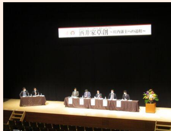
専門家5名がそれぞれ講演したのち、パネルディスカッションを開催