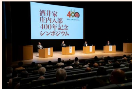
パネルディスカッションでは、西郷と庄内藩の強い交わりを確認