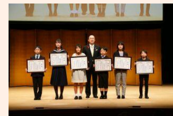
小中学生への表彰式