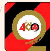
タオルハンカチ 800円