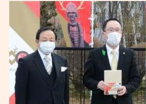
致道博物館から贈呈された「酒井家世紀」は公共施設に頒布