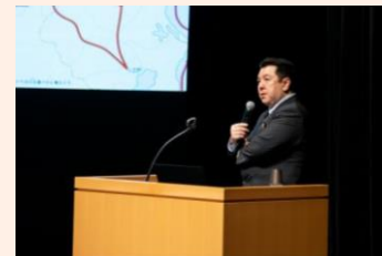
伊東氏は庄内藩の強さについて酒井玄蕃に着目