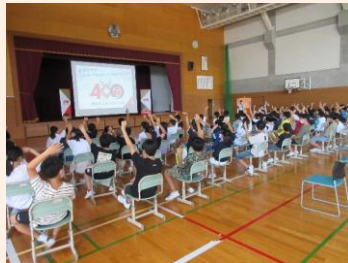
出前講座では児童・生徒の身近な歴史と文化を紹介