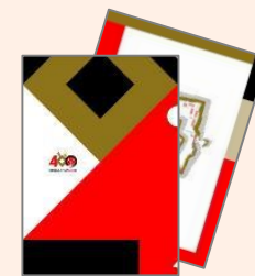
クリアファイル2種セット 500円