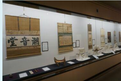
「酒井忠勝」展の国重要文化財「潮音堂」酒井忠勝が三千両で譲り受けたと伝わる