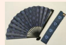
酒井家家紋を取り入れた江戸扇子と絹製扇子袋