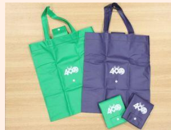
4館達成者には折りたたみエコバッグ進呈