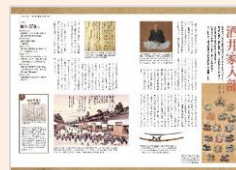
記念誌の編集 (R5年度刊行予定)