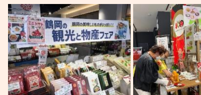
鶴岡の食や地酒などを販売しながら入部400年の歴史と文化をPR