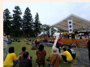
市民団体によるステージ