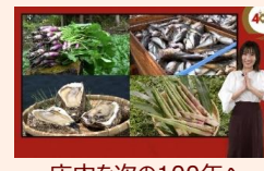
庄内を次の100年へつなぐ動画