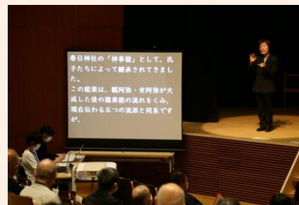
手話通訳と要約筆記を実施し、ユニバーサルデザイン指針マニュアルを作成