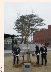
鶴岡公園での桜記念植樹 (R5.3.18)