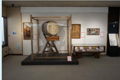
「酒井忠次」展では、歌舞伎などの題材となった「酒井の太鼓」を展示