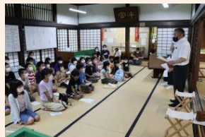
庄内論語の素読に小学生25人が挑戦