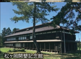
松ヶ岡開墾記念館