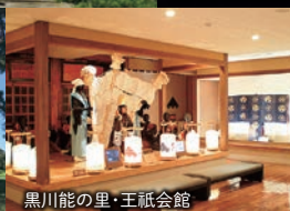
黒川能の里・王祇会館