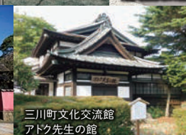
三川町文化交流館 アトク先生の館