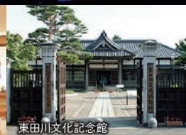
東田川文化記念館