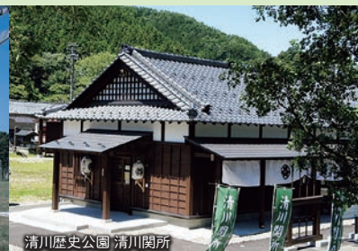
清川歴史公園 清川関所